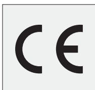
instrukcję obsługi w języku polskim